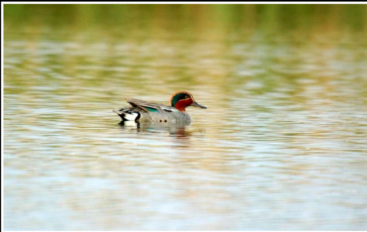
Krakwa - samiec i samica